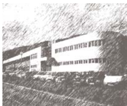
EUSKARAREN ESKULIBURUA Kapitulua: 7. NEURKETA ETA HOBEKUNTZA