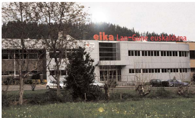
EI KA. LAN-GUNE EUSKALDUNA

Etixerakoan, azken begirada autotik eta... Nola ez dugu iristean ikusi?